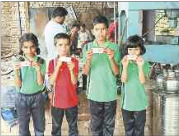
बच्चों को दिए गए एक्सपायरी मिलेट्स बार।

बार को स्कूली बच्चों को बांट दिया। जिसकी वजह एक महीना पूर्व खत्म हो गई थी। घटना की जानकारी लगने पर अखिल भारतीय विद्यार्थी परिषद पदाधिकारी व कार्यकर्ताओं ने जिला शिक्षा अधिकारी से की है। वहीं परिजन भी स्कूल प्रबंधन की लापरवाही करने पर नाराजगी जाहिर की है। अभावित के विभाग संयोजक