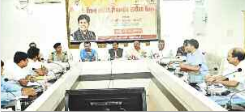
बैठक को संबोधित करते प्रभारी मंत्री।

बता दें कि शुक्रवार को प्रदेश के वित्त व जिले के प्रभारी मंत्री ओपी चौधरी पहली बार सरगुजा पहुंचे थे। इस दौरान उन्होंने कलेक्टरों से सभाकक्ष में विभागीय समीक्षा बैठक की। उन्होंने कहा कि सरगुजा के