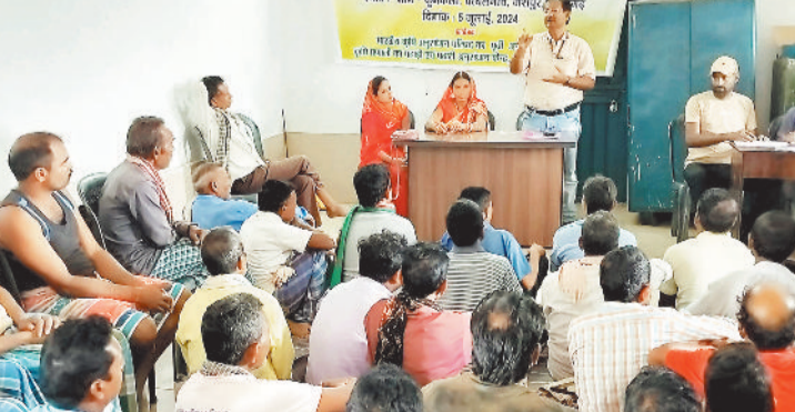
खरीफ फसलों की जानकारी देते हुए।

भारत सरकार द्वारा प्रायोजित अनुसूचित जाति उप योजना के अंतर्गत भारतीय कृषि अनुसंधान परिषद का पूर्वी अनुसंधान परिसर-कृषि प्रणाली का पहला एवं पठारी अनुसंधान केंद्र, रांची द्वारा जिले के ग्राम-कुमेकेला, पथलगांव में खरीफ फसल की उत्पादन तकनीक पर एक दिवसीय प्रशिक्षण-सह-जागरूकता कार्यक्रम का आयोजन किया गया।