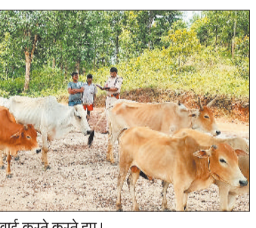
मवेशी चोरी करने वाले पर कार्रवाई करते करते हुए।

करते देख तस्करी कर रहे व्यक्ति जंगल की आड़ लेकर फरार हो गए। पुलिस द्वारा अज्ञात तस्करों से जब्त कुल 15 नग मवेशियों को जब्त कर सुरक्षार्थ रखवाया गया है एवं पशु तस्करों का अपराध दर्ज कर विवेचना में लिया गया है। फरार आरोपी के संबंध में पुलिस को