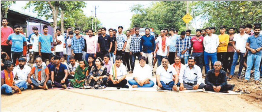
ग्रामीणों के साथ चक्काजाम करती सारंगढ़ विधायक उत्तरी जांगड़े।

उल्लेखनीय हो कि विधायक श्रीमती उत्तरी जांगड़े के गृह ग्राम मुडवाभांठा का मार्ग भी पाइपलाइन बिछाने के कारण अवरुद्ध है जिसे लेकर विधायक द्वारा ठेकेदार को बाबू बोलने के बाद भी मरम्मत नहीं किया जा रहा है जिसको लेकर विधायक ने कड़ी नाराजगी जाहिर