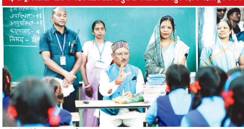
बच्चों को संबोधित करते मुख्यमंत्री।

नई राष्ट्रीय शिक्षा नीति के तहत आदिवासी समुदायों में शिक्षा की पहुंच बढ़ाने महत्वपूर्ण कदम